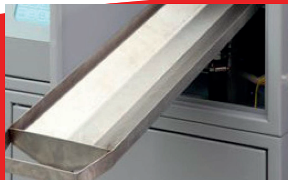
Eenvoudige en schone verwijdering van de lekbak voor UV-olie.