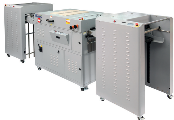
Ultra 200 PRO in combinatie met SF-300F stapelinvoer en ST-300 stapelaar