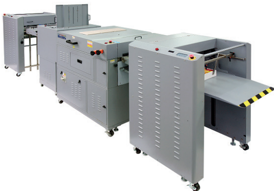
Duplex Coating- in één of twee passes

De Ultra 200 PRO is zowel CE- als UL-gecertificeerd en biedt maximale veiligheid gedurende het hele proces dankzij detectiesensoren voor papierstoringen, oververhitting, een open veiligheidsklep en een te lage coating. Terwijl de vellen papier door de UV-lamp worden uitgehard en in de uitvoerlade terecht komen, voert de ventilatie van de UV-lamp warmte af uit de hoofdkamer, waardoor te allen tijde een veilige bedrijfstemperatuur wordt gegarandeerd.