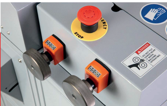
Instelknoppen voor de afstand tussen de coatingrollen voor eenmalige aanpassingen.