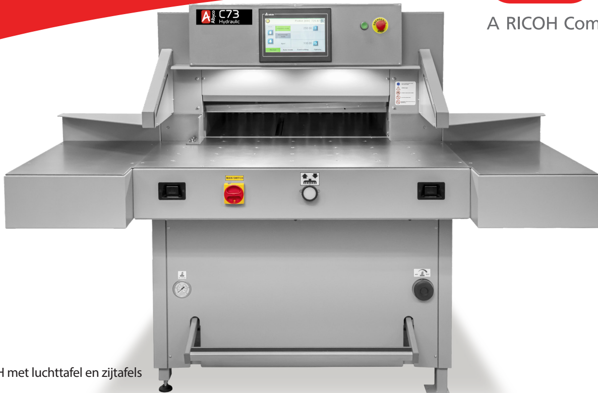
Albyco C73 H met luchttafel en zijtafels