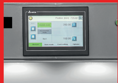
• 10" LCD-kleurentouchscreen