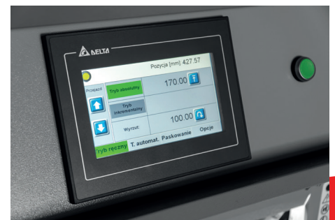
• 7" LCD-kleurentouchscreen