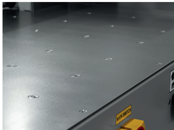
• Standaard: Luchttafel