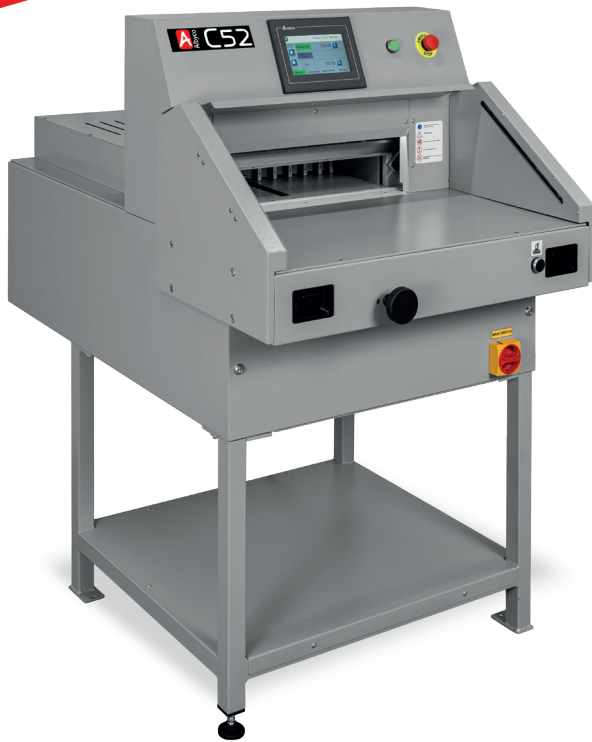
Albyco C52 zonder zijtafels