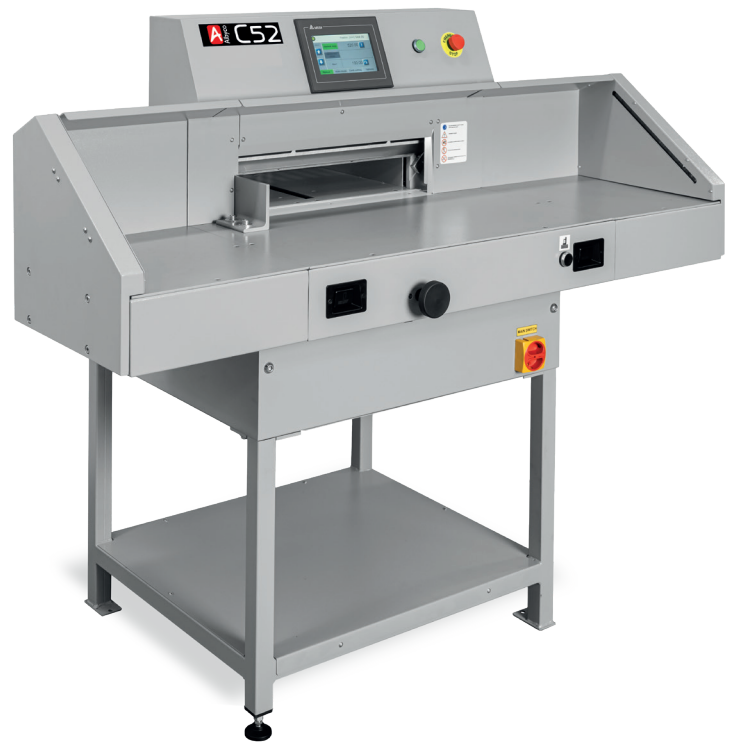
Albyco C52 met zijtafels