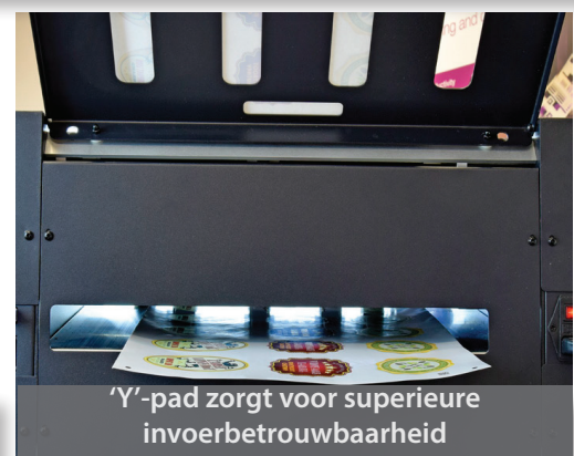
'Y'-pad zorgt voor superieure invoerbetrouwbaarheid