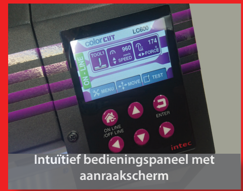
Intuïtief bedieningspaneel met aanraakscherm