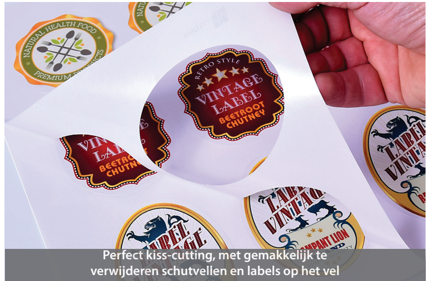
Perfect kiss-cutting, met gemakkelijk te verwijderen schutvellen en labels op het vel

Bij het uitvoeren van opdrachten past ColorCut Pro een automatisch toegewezen (bewerkbare) QR-code toe op elk van uw ontwerpen, waardoor het snijbestand wordt opgeslagen in de ColorCut Pro-opdrachtbibliotheek. Taken met QR-codes kunnen op een later tijdstip door elke operator worden gesneden - u hoeft niet te zoeken naar welk bestand waarmee u wilt snijden - er zijn geen computervaardigheden vereist! Laad gewoon de vellen, druk op start en de LC600 controleert de QR-code, haalt het snij-bestand op en stelt u in staat om een enkel vel of zelfs honderden vellen in een onbeheerde run te snijden.