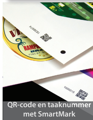
QR-code en taaknummer met SmartMark

De ruimtebesparende mediaopvanglade van de LC600 schuift weg wanneer deze niet wordt gebruikt, zodat de LC600 gemakkelijk kan worden ondergebracht in elke drukkerij. Met zijn unieke 'Y'-invoerpad wordt het medium naar binnen getrokken en weer teruggedraaid op het snijbed van de LC600, om een continue, foutloze invoer te garanderen. De digitale snijkop kan tot 750 gr. druk uitoefenen, instelbaar via de meegeleverde ColorCut Pro-software, om zelfs de dikste etiketten te snijden. ColorCut Pro-software biedt totale controle, waardoor de bediening geavanceerd en toch eenvoudig is!