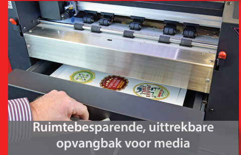
Ruimtebesparende, uittrekbare opvangbak voor media